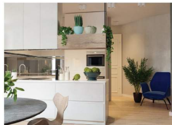
Không theo bất kỳ nguyên tắc bài trí nào, chủ nhân là người yêu cây nên chọn trang trí rất nhiều cây cho nhà bếp.