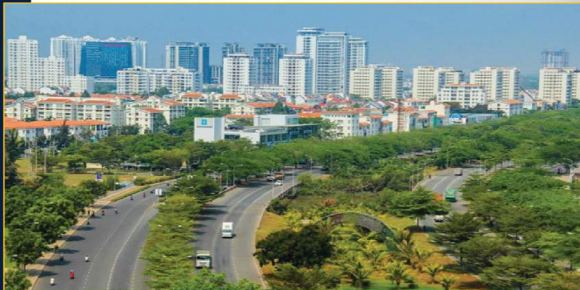
Thị trường BĐS Hà Nội ghi nhận những tín hiệu tích cực sau Tết Kỷ Hợi 2019

Ngay sau Tết, thị trường bất động sản Thủ đô ghi nhận sự tăng nhiệt nhanh chóng với những tín hiệu khả quan ở hầu khắp các dự án đang chào bán.