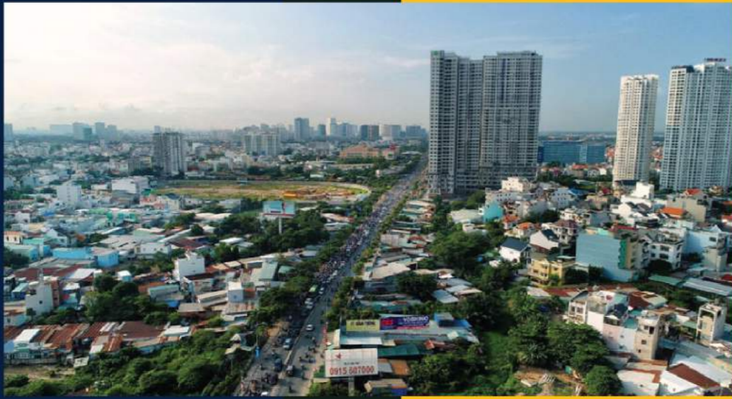
Năm 2019 dự kiến là một năm khó khăn cho thị trường về các doanh nghiệp địa ốc tại TP.HCM.

So với ngành nghề khác, các doanh nghiệp địa ốc thường bắt đầu công việc sau Tết Âm lịch muộn hơn, nhưng không vì thế mà những kế hoạch khai Xuân kém phần sôi động.