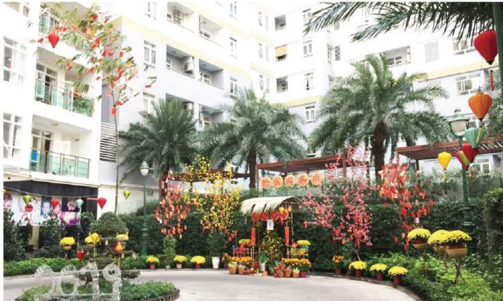
Khu vực trang trí Tết tại Him Lam Riverside

VỪA QUA, PHÒNG DỊCH VỤ QUẢN LÝ BẤT ĐỘNG SẢN HIM LAM LAND ĐÃ TỔ CHỨC CUỘC THI TRANG TRÍ TẾT MỪNG XUÂN KỶ HỢI 2019 TẠI CÁC KHU CĂN HỘ CỦA HIM LAM LAND.