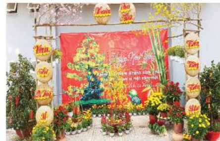
Khu vực trang trí Tết tại Him Lam Nam Khánh

Với ý tưởng tái hiện lại Tết cổ truyền, đem phong vị tết xưa đến các cư dân nhí để các bé hiểu hơn về phong tục tập quán truyền thống, Khu căn hộ Him Lam Riverside đã xuất sắc đạt được giải Nhất của cuộc thi.