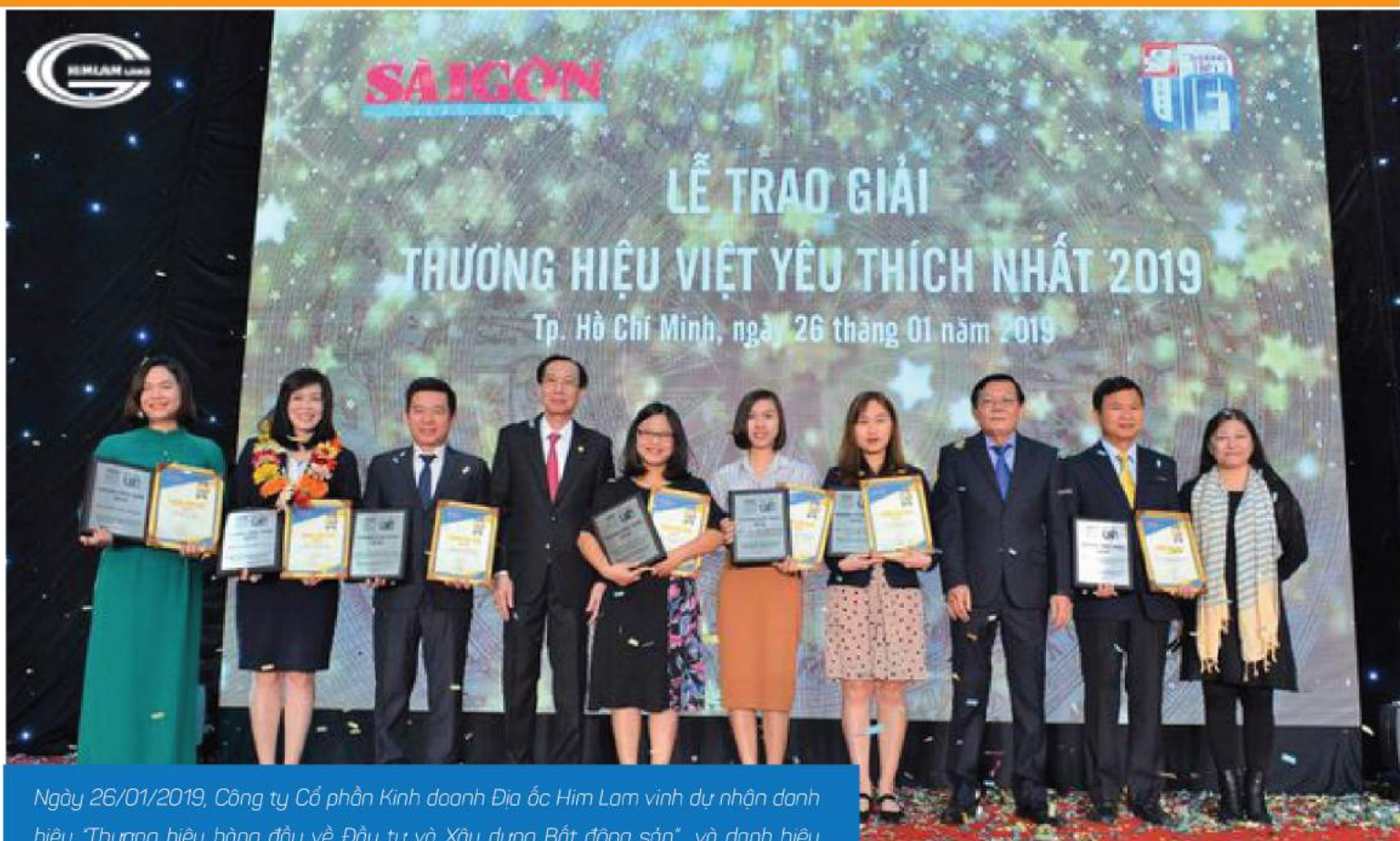
Ngày 26/01/2019, Công ty Cổ phần Kinh doanh Địa ốc Him Lam vinh dự nhận danh hiệu "Thương hiệu hàng đầu về Đầu tư và Xây dựng Bất động sản" và danh hiệu "Thương hiệu vàng" do bạn đọc Báo Sài Gòn Giải Phóng bình chọn tại lễ trao giải "Thương hiệu Việt yêu thích nhất 2019".

Nhằm tôn vinh các doanh nghiệp xây dựng thương hiệu Việt uy tín, chất lượng, đồng thời nâng cao tính cạnh tranh cho hàng Việt Nam, báo Sài Gòn Giải Phóng (SGGP) tổ chức cuộc bình chọn và trao giải "Thương hiệu Việt yêu thích nhất năm 2019".