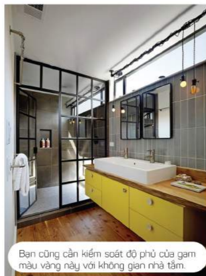
Bạn cũng cần kiểm soát độ phù của gam màu vàng này với không gian nhà tắm.