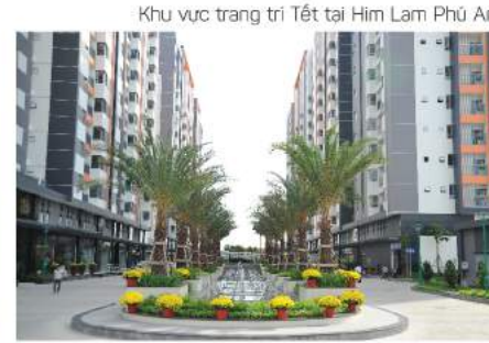
Khu vực trang trí Tết tại Him Lam Phú An