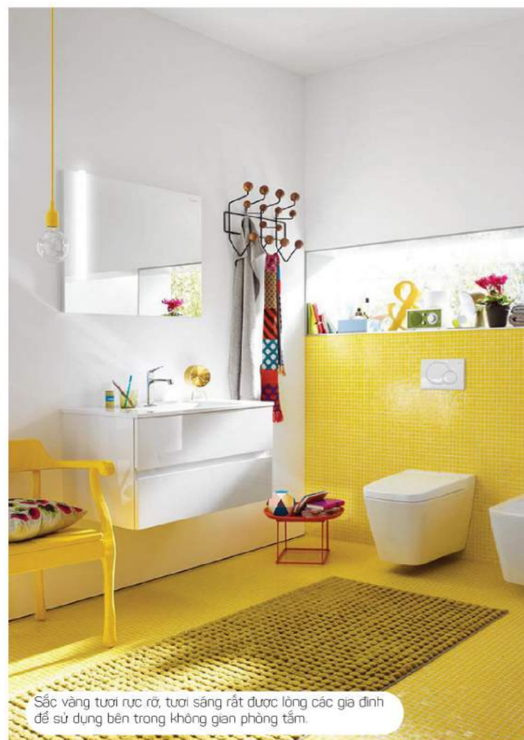
Sắc vàng tươi rực rỡ, tươi sáng rất được lòng các gia đình để sử dụng bên trong không gian phòng tắm.

Nếu là một tín đồ thời trang thì không ai là không biết rằng sắc vàng tươi rực rỡ đang là gam màu được yêu thích nhất trong mùa hè này. Nhưng có lẽ, có một điều mà bạn còn chưa rõ đó là, sắc vàng tươi này còn được rất nhiều gia đình ưu ái lựa chọn cho căn phòng tắm của mình. Gam màu vàng tươi sáng, dễ dàng mang đến đến người dùng một không gian sáng khoái, thư thái, vô cùng dễ chịu. Đó cũng là nguyên nhân lý giải vì sao sắc vàng tươi lại được phủ sóng đến không gian sống của nhiều gia đình đến vậy.