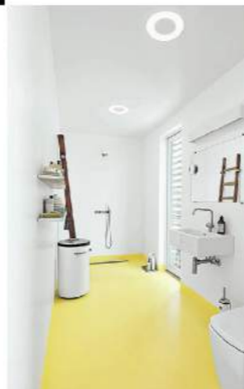
Để có được những căn phòng tắm mang sắc vàng tươi rực rỡ thì cũng có một vài điều bạn cần chú ý đến trong quá trình thiết kế.