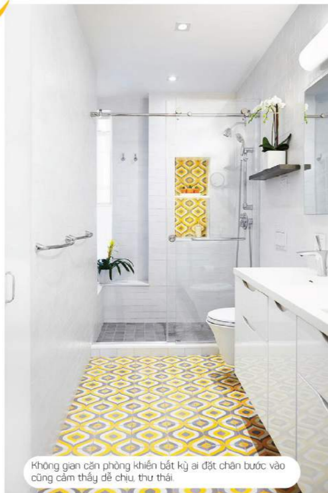
Không gian căn phòng khiến bất kỳ ai đặt chân bước vào cũng cảm thấy dễ chịu, thư thái.